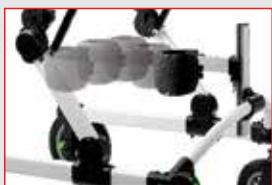
FACILITADOR DE PASSOS