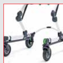
BARRA DE PESO PARA ESTABILIDADE