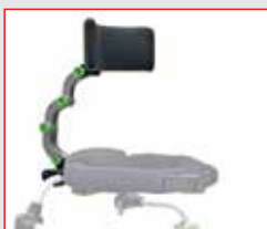
APOIO DE CABEÇA AJUSTÁVEL