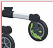
FREIOS DE PÉ