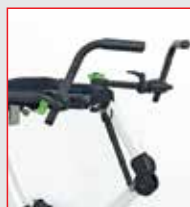
APOIO DE MÃOS ERGONÔMICO