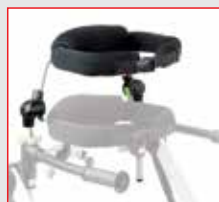
APOIO DE TRONCO